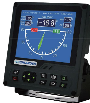
HID-EID601 电子倾斜仪复示器